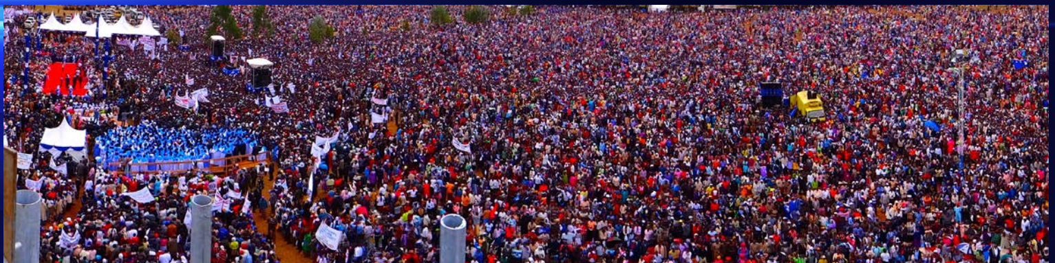
PIENI OSA JÄTTIMÄISESTÄ IHMISJOUKOSTA, JOKA KOKOONTUI 45-HEHTAARIN ALUEELLE VIERI VIEREEN TÄYTTÄEN HERRAN KOKOUKSEN.