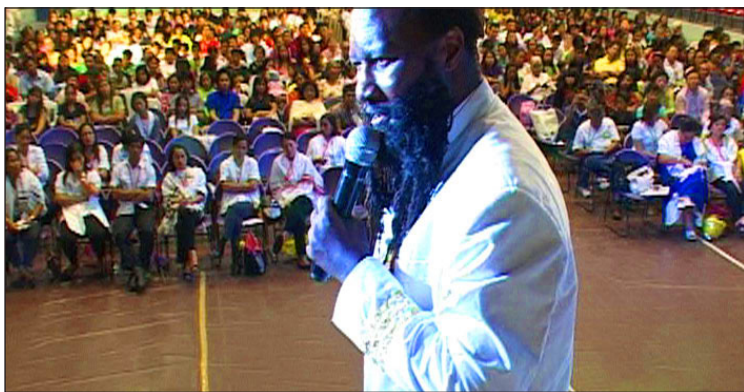
MANILA, FILIPPIINIT, VALTAVA PASTORI- KONFERENSSI

joka päästi orjuutetun ihmiskunnan vapaaksi kukistaen täten vangitsijan. Se on vakava muistutus niistä korkeista kustannuksista ja hinnasta , jonka Jeesus Kristus maksoi seurakunnan pelastuksen puolesta. Tällä tavoin HERRA käyttää tätä näkyä varoittaakseen tämän päivän seurakuntaa, että se ei voi millään tavoin jatkaa armon väärinkäyttöä sen korkean lunnaan takia, joka on maksettu.