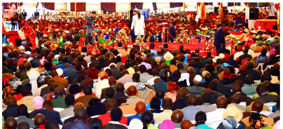
KANSAINVÄLINEN PASTORIKONFERENSSI / 29.-31. ELOKUUTA, 2014 NAKURU KENIA

Kellon alas taivaalle tuona merkittävänä päivänä 3. toukokuuta 2007, niin HÄN käytännössä julisti sanoman: VERI! VERI! VERI! KARITSAN TÄYDELLINEN VERI! ■