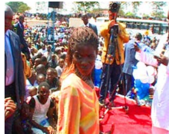
Kuurot Korvat Pokshtavat Auki / HERRA kirjaimellisesti poksautti auki kuurot korvat, niin että ne pystyivät nyt reagoimaan ääneen spontaanisti. Ylistys HERRALLE!

identiteetin. Pyhä elämä on ainoa mittakeppi, jota HERRA käyttää arvioimaan, onko seurakunta todella peitettyä Jeesuksen VERELLÄ. Klo 23:59