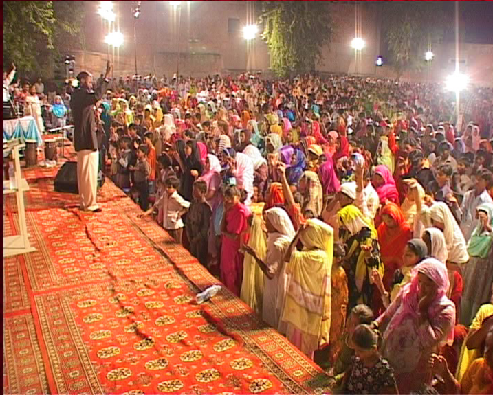
Monet muslimit vastaanottivat HERRAN

"VALMISTAJA". Sen sijainti taivaan sisäänkäynnin luona myös suuresti ohjeistaa uskovia, että se julistaa, että ainoastaan keskiyön tapahtuman kautta heille on mahdollista päästä ikuisuuteen. Tämä taivaan kultainen kello täten nauttii korkeasta asemasta tehtävänään valmistaa koko maailmankaikkeus, kaikki kansakunnat mukaan lukien, Messiaan loisteliaaseen tulemukseen. Tämän kellon julistama keskeinen teema maailman kansakunnille on opinkappale, joka alleviivaa kristittyjen uskovien tarvetta aloittaa prosessi sivelemällä kristittyjen sydämiensä oven pielet Jeesuksen täydellisellä VERELLÄ. Tällä tavoin tästä kellosta on tullut taivaallinen joukko , joka osoittaa kansakunnat Jeesuksen luo sekä VALMISTAJA sitä varten mitä on juuri tulossa tapahtumaan maailmalle. Tekemällä näin, tämä JUMALAN kello vetää voimakkaasti ihmisten huomion siihen aitoon vanhanajan raamatulliseen Golgatan VEREN PARANNUKSENTEKOON sekä todistamaan vakavasti Jeesuksesta Nasaretilaisesta. Se on ajallaan oleva taivaallinen joukko, joka rohkeasti todistaa Messiaan loisteliaan Valtakunnan tulemukselta ja sen kansalaisuuden vaatimuksista. Varoittamalla kansakuntia valmistautumaan , tästä valtavasta kultaisesta kellosta taivaalla on tullut