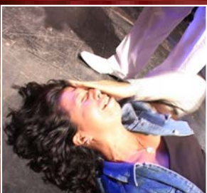
Sokea Silmä Paranee Livenä Kameran edessä