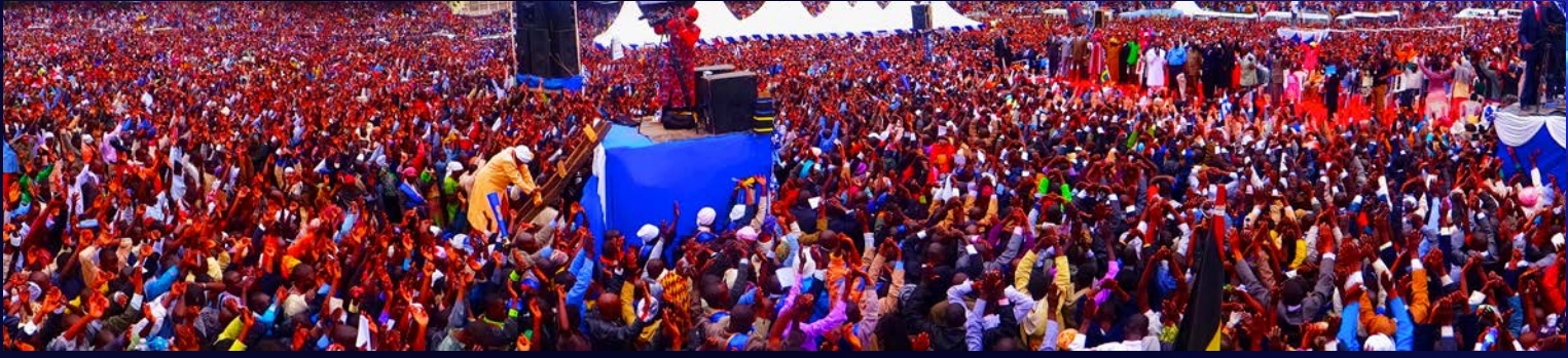
PIENI osa valtavasta väkijoukosta, joka tungeksi HERRAN uudenvuoden yökokouksessa.

Tehdäkseen näin, JUMALA KAIKKIVALTIAS kuitenkin tarvitsi sanansaattajan, joka tulisi levittämään HÄNEN vapauttamisohjelmansa maan päällä. Tuolloin HÄN näki sopivaksi lähettää heille Profeetta Mooseksen. Kun heidän vapautuksensa hetki oli tullut lähemmäs, niin ISRAELIN JUMALA Puhui heille keskiyön hetkestä , jona HÄN ITSE tulisi alas ja asettaisi paikoilleen erityisiä hengellisiä välineitä, jotka tulisivat toteuttamaan tuon vapautuksen . Helpottaakseen HÄNEN lunastusohjelmansa levittämistä, KORKEIN JUMALA asetti tiettyjä avainkriteerejä , joita Israelin tuli noudattaa ammentaakseen enimmäismäärän HÄNEN taivaallisesta väliintulostaan. Ensimmäinen standardi, jonka HERRA julisti, oli että tämä lunastus toteutettaisiin keskiyön hetkenä . Näinollen, taivas tulkitsi israelilaisille mitä keskiyön vapautus tulisi sisältämään. Kuvailen sitä nousuksi Kotkan siipien alla, HERRA eteni neuvomaan Israelia sen tarpeesta valmistautua keskiyön hetkeen . Tämän seurauksena, HERRA lähetti Mooseksen määräämään Israelin kiireellisesti asettamaan paikoilleen tiettyjä protokollia heidän keskiyön vapautustaan varten. ?Yg_Y]gh} hc:]a ]bHJHdc^Yb^ci_cggUz^c]HJ <9FF5