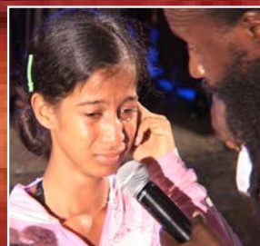
Täysin Kuurot Korvat Pokshtavat Auki

Profeetta Daniel näki, että tulisi olemaan kaksi eri tyyppistä seurakuntaa; yksi seurakunta, joka ylöstemmataan ikuiseen elämään ja saman aikaisesti toinen seurakunta, joka kituu helvetissä. Sen ryhmän sisällä, joka ylöstemmataan , Daniel näki kaksi alaryhmää; ne, jotka ovat viisaita ja johdattavat monia vanhurskauteen ja toinen ryhmä on viisas seurakunta, joka elää HERRAN