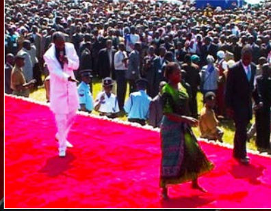
KISUMUN HERÄTYSKOKOUS / TAMMIKUU 2012

tulisi sivellä VERTA ovien karmeihin, on saapunut tämä julistus nostaa esille sen tosiasian, että seurakunta perusolemuksessaan on rikkonut synnillisellä elämäntyyllillään JUMALAA vastaan. Kuinka väkevä tapa, jolla tämä taivaallinen joukko kutsuu kansakuntia puhdistamaan synnin pois heidän sydämistään ja syleilemään uskonpuhdistusta heidän pelastuksessaan! Voidaan siis vakuuttavasti sanoa, että tämä kultainen kello, joka tulee keskiyön hetken VALMISTAJANA, lopulta vaatii parannuksenteon hedelmiä seurakunnalta. Tämän luonteinen keskeinen opinkappale todistaa tämän kellon kautta seurakunnan tarpeesta syvämmänsä sisäiseen vakaumukseen PARANNUKSENTEON kautta. Vanhurskauden hedelmä, jota tämä klo 23:59 osoittava näky ihmisten sydämiltä vaatii, on pääasiallisesti tarkoitettu ilmaisemaan heidän sisäisen puhdistumisensa ja uudistumisensa ulkoista ilmentymää. Tämän kellon palvelustyö ei kuitenkaan ole unohtanut varoittaa niitä, jotka eivät noudata PARANNUKSENTEON pasuunan soittoa siitä, että HÄNEN kirveensä, joka tulee, on jo puun juurella. Samalla kun tämä palvelustyö julistaa toivon hetken läheisyyttä, niin se kuitenkin myös