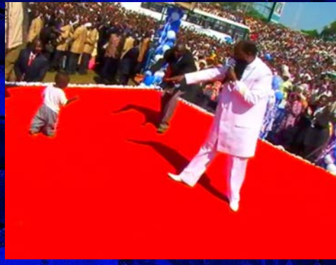
KAKAMEGAN GRAND HERÄTYSKOKOUS / TAMMIKUU 2013

Heti kun HERRAN PROFEETTA käveli stadionille, niin tämä lapsi, joka oli syntynyt rampana nousi ylös ja alkoi kävelemään ilman apua.