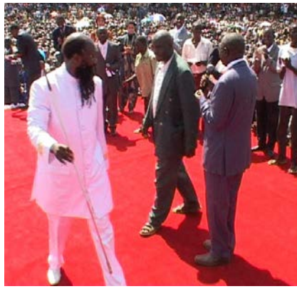
Täysin sokeat silmät paranevat ja mies luovuttaa pois valkoisen kävelykeppinsä.

nassa, noituus seurakunnassa, väärät profeetat ja valheapostolit asetettuina paikoilleen, niin totisesti HERRA on oikeutettu kyseenalaistamaan, onko Kristuksen seurakunta ollenkaan peitettyä Jeesuksen VERELLÄ?